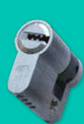
Cilindro di sicurezza K2 Safety cylinder K2