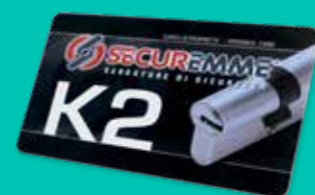
Tesserina di duplicazione chiavi Duplication keys card