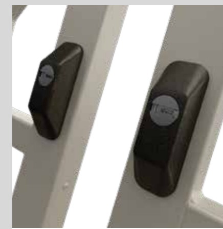
Defender esterno per cilindro passante External Defender for passing cylinder

"Sikura" the first and only security bar system with articulated joint certified as Class 4. The security bar system consists of a perimeter frame in galvanized steel with a 20x30 mm section and 2 mm thick. The perimeter frames are available in 7 different versions to offer the most suitable opening for your needs. The hinges are manufactured in steel using a micro-casting process; its particular structure leads to an overall security bar size of just 35mm, allowing its use even in presence of mono-blocks with no need to make changes to existing windows. Each security bar is equipped with two compensation profiles, U shaped and with 20x35x20 size, suitable to correct any out of square of the vertical sides. The wall mounting of the frame is ensured by dowels and it does not need any masonry.