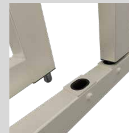
Puntale di chiusura superiore / inferiore Closure tip upper lower