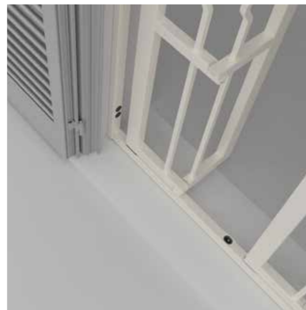
Posizione: Apertura totale interna Position: Total internal opening