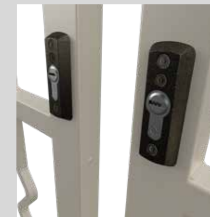
Mezzo cilindro Half cylinder