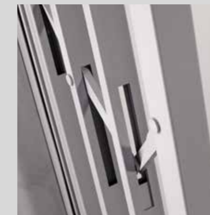
Leve orizzontali carbonitrate Horizontal carbonitrided levers