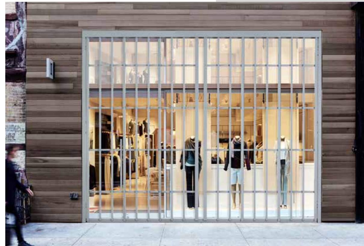
Esempio di installazione estesa / Example of extended installation

The lock is to insert two closing points, upper and lower, with excursion of the tips of 25 mm. 1/2 anti-drill cylinder with a European profile facing inside the room.