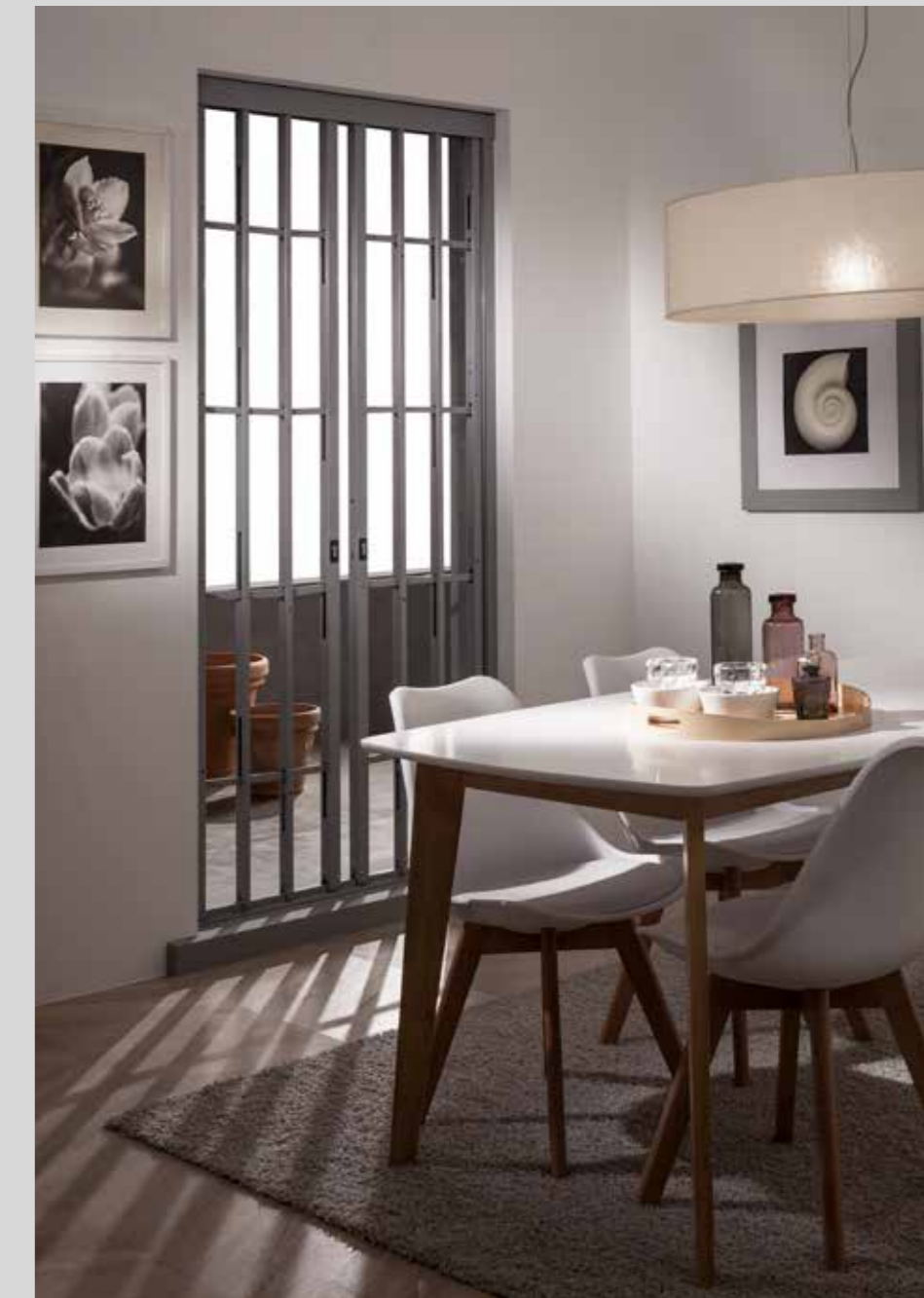
Vista interna Internal view