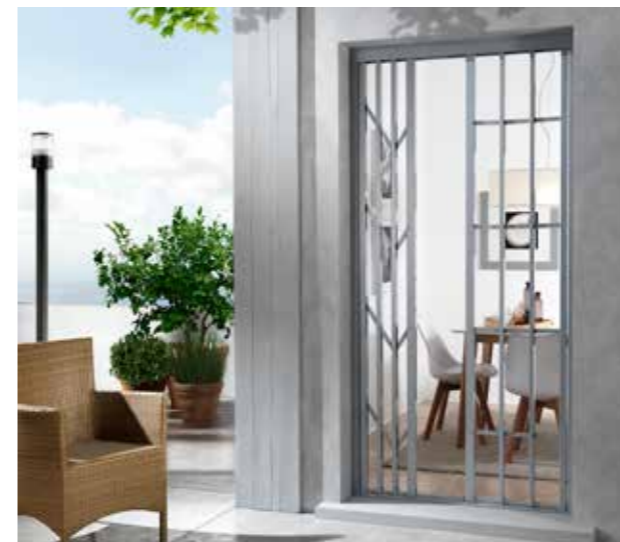
Posizione: Apertura parziale / Position: Partial opening