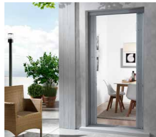
Posizione: Apertura totale / Position: Total opening