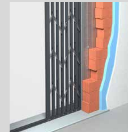
Versione con cassonetto a scomparsa Retractable drawer version