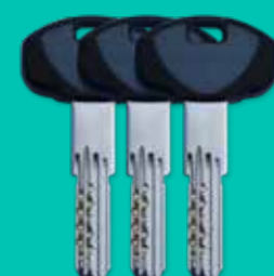
3 chiavi padronali 3 keys