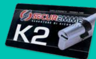
Tesserina di duplicazione chiavi Duplication keys card