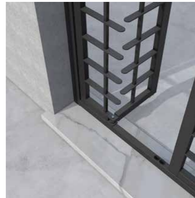
Posizione: Mezza anta aperta verso l'interno Position: Half door internal opening