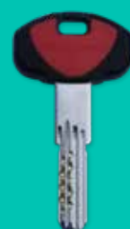
Chiave di cantiere Construction site key