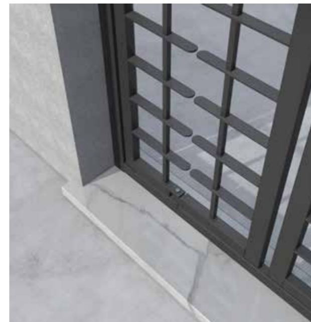
Posizione: Chiusa Position: Closed

The ACS and ACS 180 versions come with a special patented hinge, which has a double function, open to tilt the door completely outwards, closing the self-locking frame inside the chassis using a carbon steel pin, offering additional tear-off anchorages.