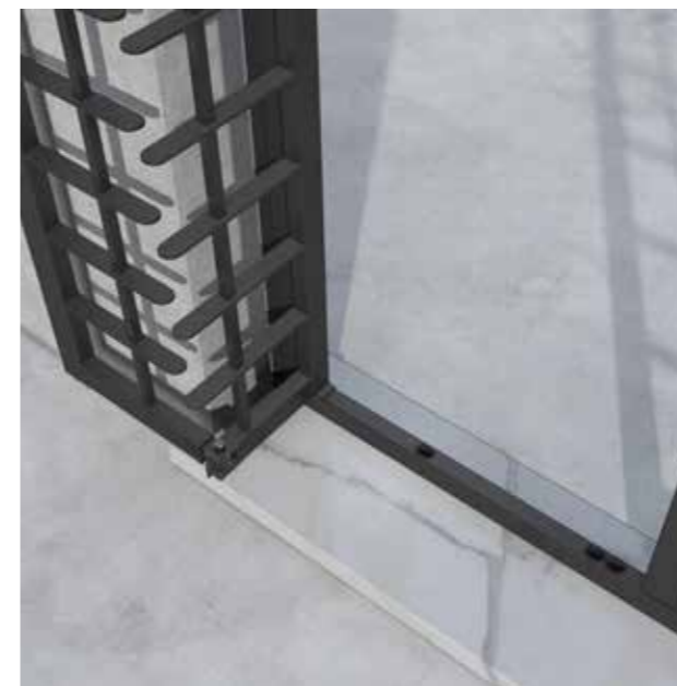
Posizione: Aperta completamente verso l'esterno Position: Total external opening

La caratteristica della grata "Evoluta 18" è senza dubbio lo speciale snodo brevettato. Il fissaggio a parete del telaio è garantito tramite tasselli e non necessita di nessuna opera muraria. Le ante sono realizzate con profili di acciaio zincato di sezione 40/50x30x2 mm.