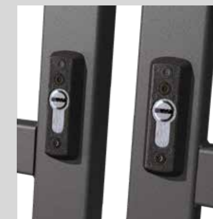
Defender interno mezzo cilindro Internal defender half cylinder