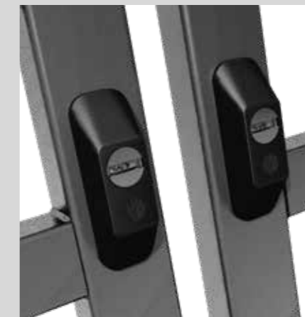
Defender esterno per cilindro passante External Defender for passing cylinder

The doors are made of galvanized steel profiles of 40/50x30x2 mm thick section.