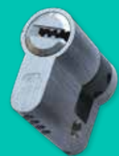
Cilindro di sicurezza K2 Safety cylinder K2